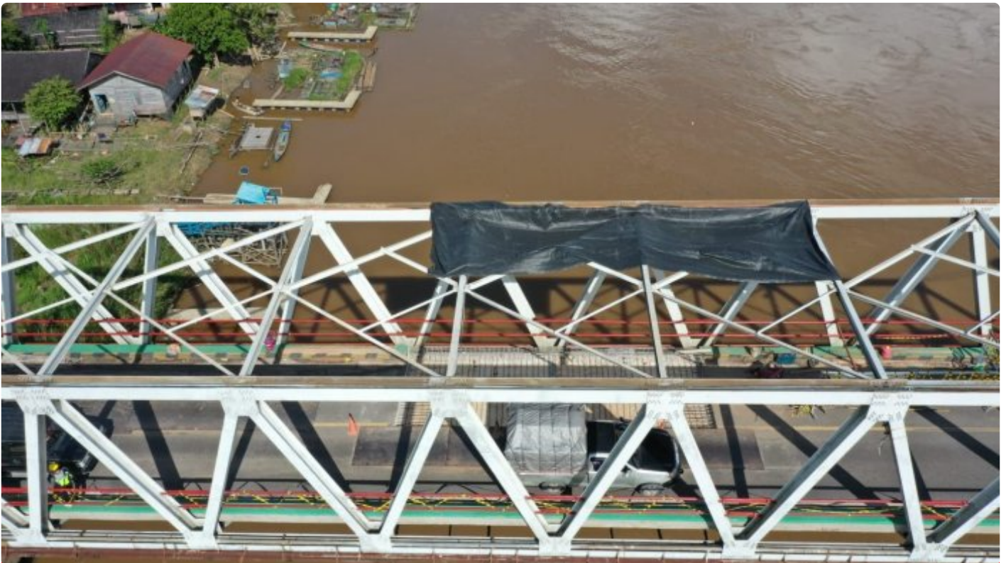
Jembatan Kasongan (Sei Katingan) Dalam Proses Perbaikan Oleh BPJN Kalimantan Tengah

KATINGAN - Penutupan jembatan Sei Katingan atau jembatan Kasongan, Kabupaten Katingan yang direncanakan akan ditutup pada tanggal 27 Maret 2023, akan diundur dua hari yaitu pada tanggal 29 Maret 2023.